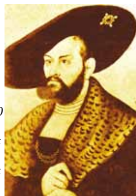
Albrecht I von Hohenzollern , portret pędzla Lucasa Cranacha Starszego