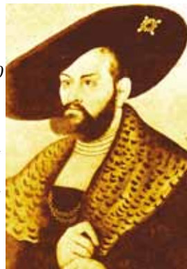
Albrecht I von Hohenzollern , portret pędzla Lucasa Cranacha Starszego

Wydział Budownictwa i Ochrony Środowisk UM w Olecku, Młodzi dla