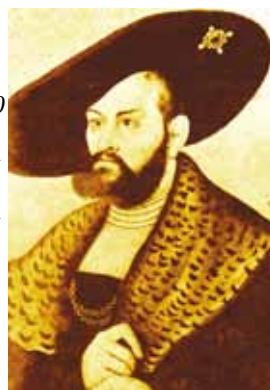
Albrecht I von Hohenzollern , portret pędzla Lucasa Cranacha Starszego