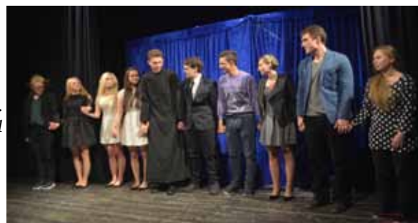
aktorzy spektaklu „Cień”